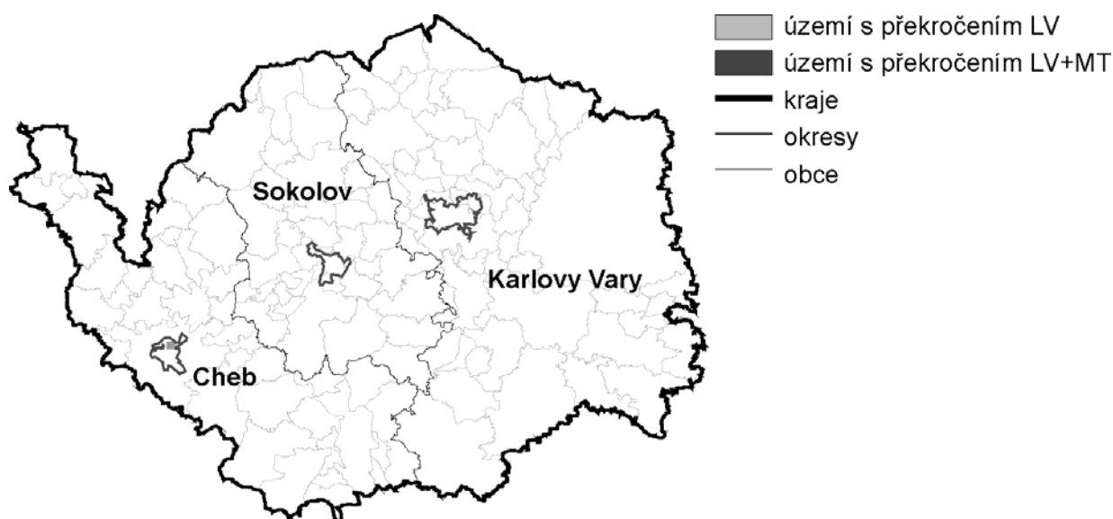
Obrázek 1: Území Karlovarského kraje, na kterém došlo v roce 2006 k překročení imisního limitu (LV) nebo imisního limitu navýšeného o mez tolerance (LV + MT) pro alespoň jednu ze sledovaných znečišťujících látek, bez zahrnutí ozonu